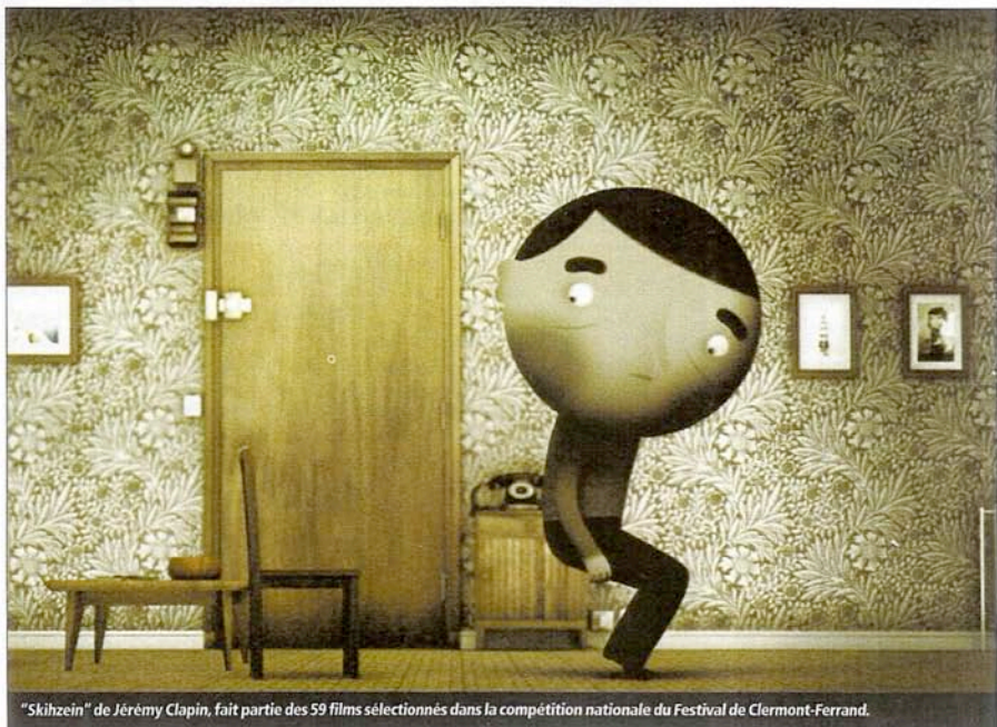
"Skihzein" de Jérémie Clapin, fait partie des 59 films sélectionnés dans la compétition nationale du Festival de Clermont-Ferrand.

Les modes de consommation nomade sont donc variés et viennent occuper le créneau délaissé de la VàD sur les téléphones 3G. Beaucoup d'espoirs reposaient en effet sur les opérateurs de téléphonie mobile et leur potentiel de diffusion du court. Ces derniers se sont recentrés sur d'autres formats courts (clips, bandes-annonces et Web séries, notamment) et privilégient d'autres terrains pour diffuser du court métrage (lire page 20). Par exemple en proposant des packs sur TV-IP, à l'image de VODmania, qui a passé un accord avec SFR